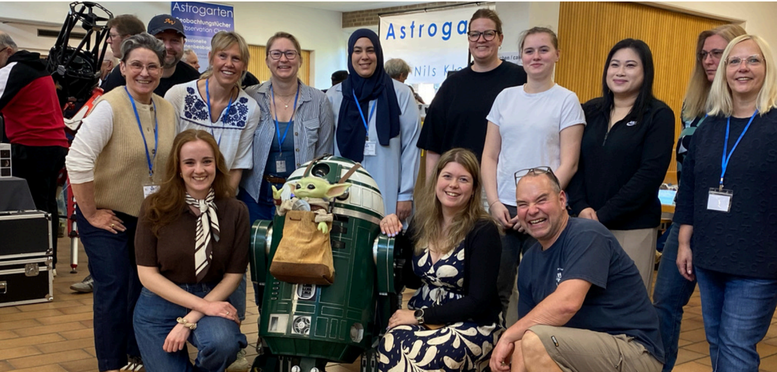
Team Astrobörse 2026 (siehe Seite 4)